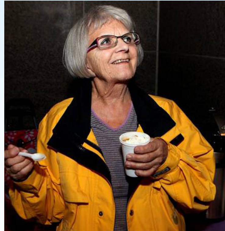
Ängeln på Malmskillnadsgatan

Työskentelee prostituoitujen, narkomaanien ja kodittomien parissa (morsanelise@gmail.com)